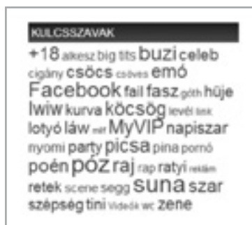
Kulcsszavak a napiszar posztjaiban

A Szubjektív blog a következőként foglalta össze az oldal tartalmi elemeit: 4