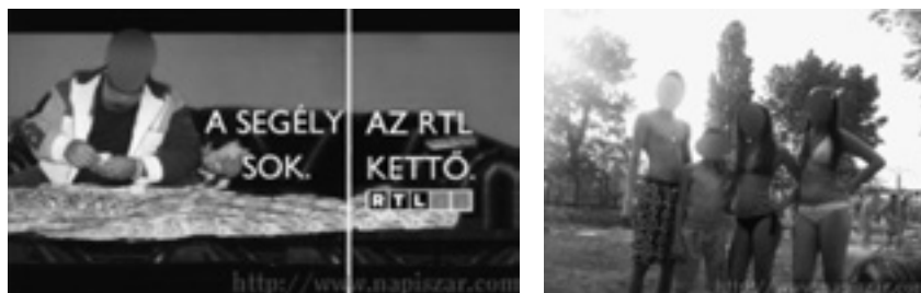
„Családiból nyaral a család”

A roma és a magyar társadalom szembeállításában az egyik sarkalatos pontnak a munkavállalást tartják a szerkesztők. Számos elemzett bejegyzésen megjelenik utalás szintjén a segélyből való élés és a munkakerülés. A roma a bemutatott képek szerint nem dolgozik, hanem segélyt kap, amiben latens módon benne van a feltételezés, hogy a dolgozó magyar társadalom tartja el őket.