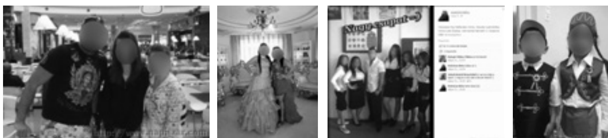
„Ez már a totális mélyszegénység...” Forrás: napiszar.com

A következő megjelenített motívumok a roma és a magyar kultúra és identitás szembenállásáról szólnak. A roma származású hírességek ugyanúgy gúny tárgyát képezik, mint a sajátosan roma öltözéknek titulált viselet. Az „ő” viseletük tehát nem a „mi” viseletünk. A mellékelt képeken láthatjuk, hogy roma iskolások magyar címer előtt állnak, egy másikon pedig magyar népviseletben vannak. Ez pedig pontosan azért helytelenített viselkedés, mert a két csoport szemben áll egymással, és ennek alátámasztására jól elkülöníthető jegyekre van szükség.