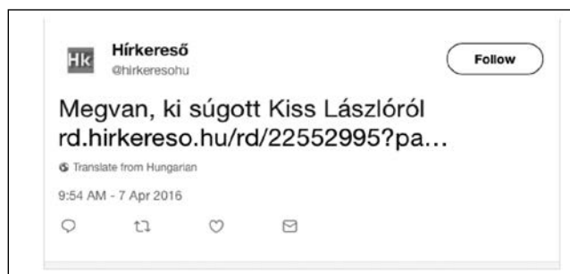
4. ábra Twitter-használat a breaking hírek publikálására

A blogok közül a kettosmerce.hu és a sztarklikk használta a Twitteret, illetve a híraggregáló hírkereső.hu és a szélsőjobboldali nemzeti.net is. Megfigyelhető volt, hogy az Anderson nyomán azonosított digitális kultúra nyitottsága, partícipatív jellege a magyar kontextusban alig érvényesül. Egy-egy újság (például a hvg.hu) linkelt más újságok cikkeire, de a legtöbb a saját breaking anyagait tette fel, alapvetően saját anyagainak promotálására használva a mikroblogoldalt (lásd a 4. ábrát).